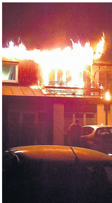
Der Brand begann auf dem Balkon. Er griff auf die Fassade und den Dachstock über. CARMEN MEYER

Beim Eintreffen der Feuerwehr hatte das Feuer jedoch bereits die Fassade und das Dach erfasst. Sofort wurde zur Unterstützung der Stützpunkt Zofingen mit der Autodrehlei-